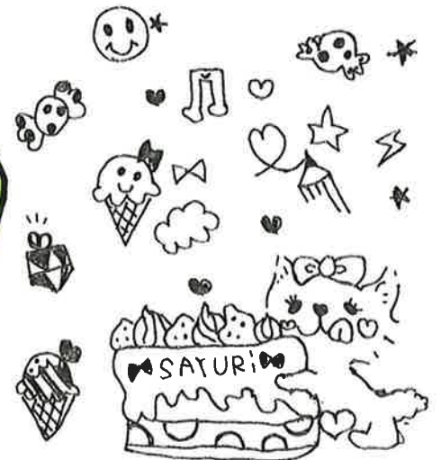
茶連慈ベーカリーの商品一覧表